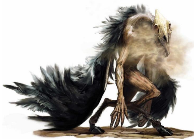
Fot. Demon w postaci odrażającego zwierzęcia

W tym rozdziale wymienimy różne bezceństwa i plugastwa czynione przez demony, aby świętych rozpraszać, nękać i przerywać modlitwę lub pracę. Próbowały to robić wywołując przykre dla zmysłów człowieka zjawiska :